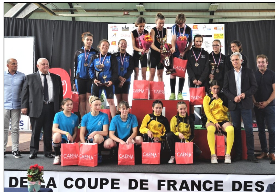
DE LA COUPE DE FRANCE DES

Dans l'ensemble, la préparation et le déroulement de la compétition se sont déroulés dans d'excellentes conditions, et la Fédération et les clubs présents ont fait l'éloge de l'organisation. Celle-ci n'aurait pu être aussi réussie sans la participation active des nombreux bénévoles ayant répondu activement à l'appel du club et également sans le soutien généreux des partenaires privés ou institutionnels comme la Ville de Caen, le Département du Calvados et la Région Normandie.