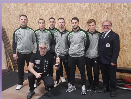
L'équipe du CA Evron 53 hm