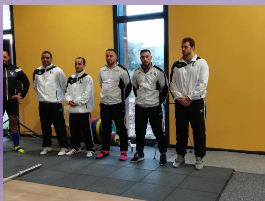
L'équipe du CJF laval/Voutré