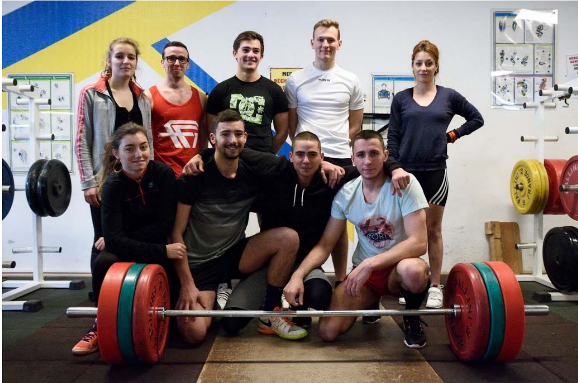
Les participants ...