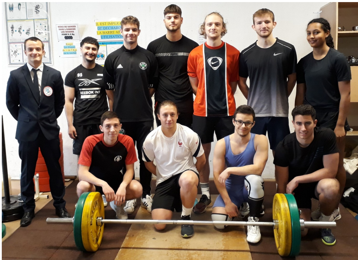
CRITERIUM FFSU – 13/01/2022