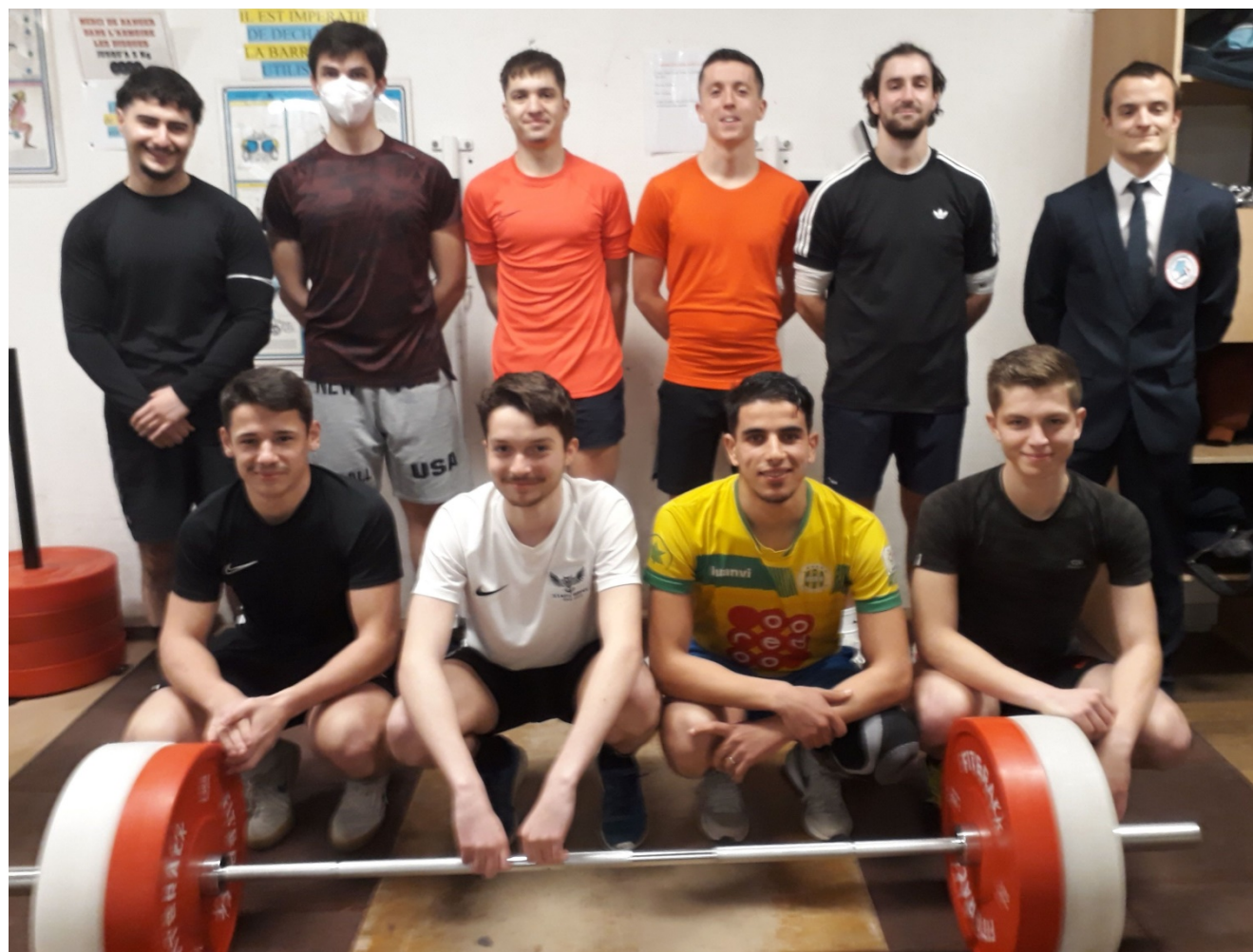
CRITERIUM – 8ème match